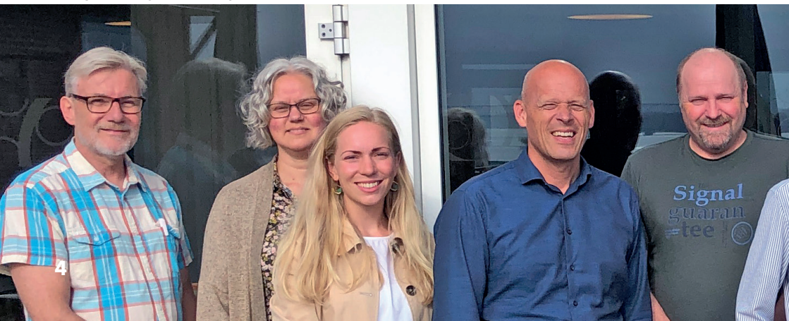
IAS' bestyrelse og medarbejdere

Freden i små samfund i ulandene er truet af stammekrig og magtkampe for at få tildelt ressourcer, f.eks. vand eller andre basale fornødenheder, og der er uroligheder og internt fordrevne pga. politiske optøjer, uenighed om jordlodder, og