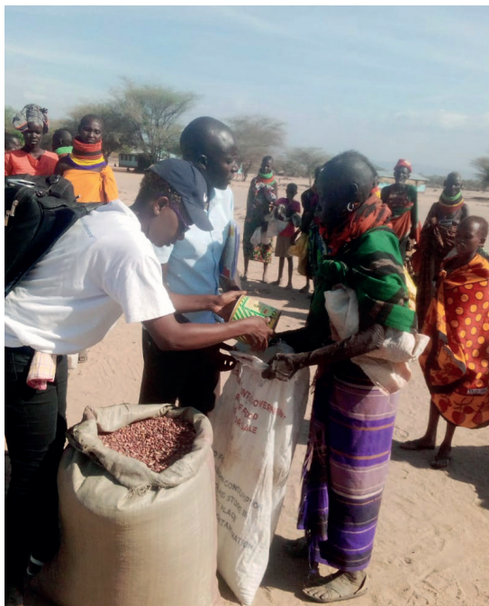
Uddeling af mad