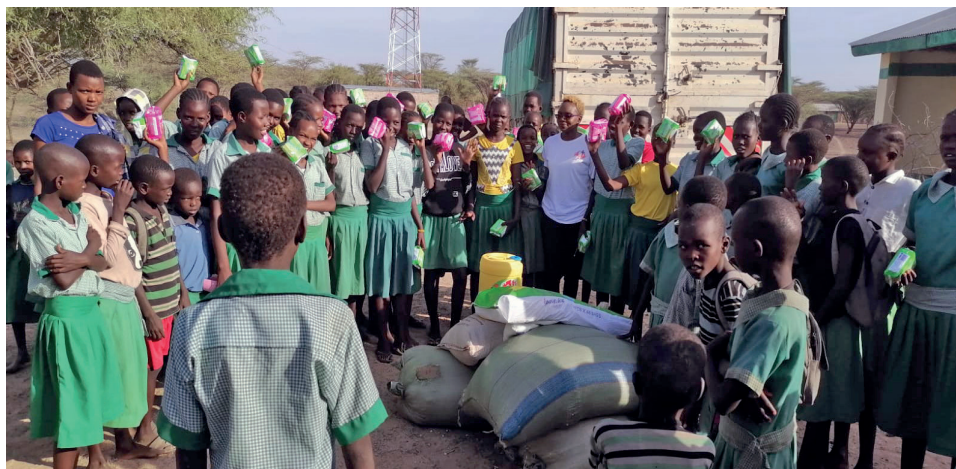
Uddeling af mad

Desuden arbejder vi som et element i projektet også med det, som vi kalder kønsbaseret vold. Vi er næsten færdige med at producere fødevarerne, som bliver produceret i Addis Abba. Nu skal de fordeles; det begynder vi med i næste uge. I Etiopien er det knap 4.000 men-